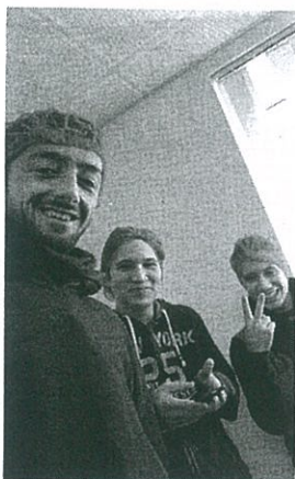
Alunos em estágio na Áustria Curso Profissional em Eletrónica, Automação e Comando da Escola Profissional de Aveiro

No último ano do Curso Profissional fui para a Áustria por dois meses, estagiar na Escola Htl-Wolfsberg e numa empresa privada, Standwerke-Wolfsberg, juntamente com outros colegas. Ficámos alojados numa residência em frente ao estádio da equipa de Wolfsberg. Penso que a experiência de quem faz Erasmus vai muito além daquilo que se pensa, festas, noites e pouco estudo! A realidade é outra e a maior contribuição que tem para o nosso desenvolvimento pessoal é, sem dúvida, permitir-nos crescer como indivíduos no seio de uma sociedade multicultural. Conhecer e conviver com outras culturas, outros hábitos e até outras comidas, é do melhor que pode haver!